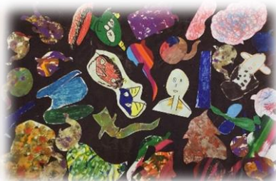
男性ご利用者様作品 「ゴースト・フェスティバル」

ゴーストフェスティバルをテーマにみんなでゴーストを描きゴーストの形に切りとって貼り楽しい雰囲気を出しました。グループ名は「のぞみボーイズ・ハードメンズ」です。