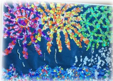
女性ご利用者様作品 「花火と海」